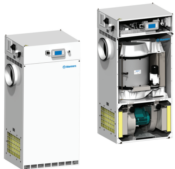
ML met Climatix Controls

De ML-ontvochtigers voldoen aan zowel de geharmoniseerde Europese normen als aan de CE markeringspecificaties.